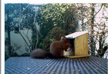
Video mit Untertitel